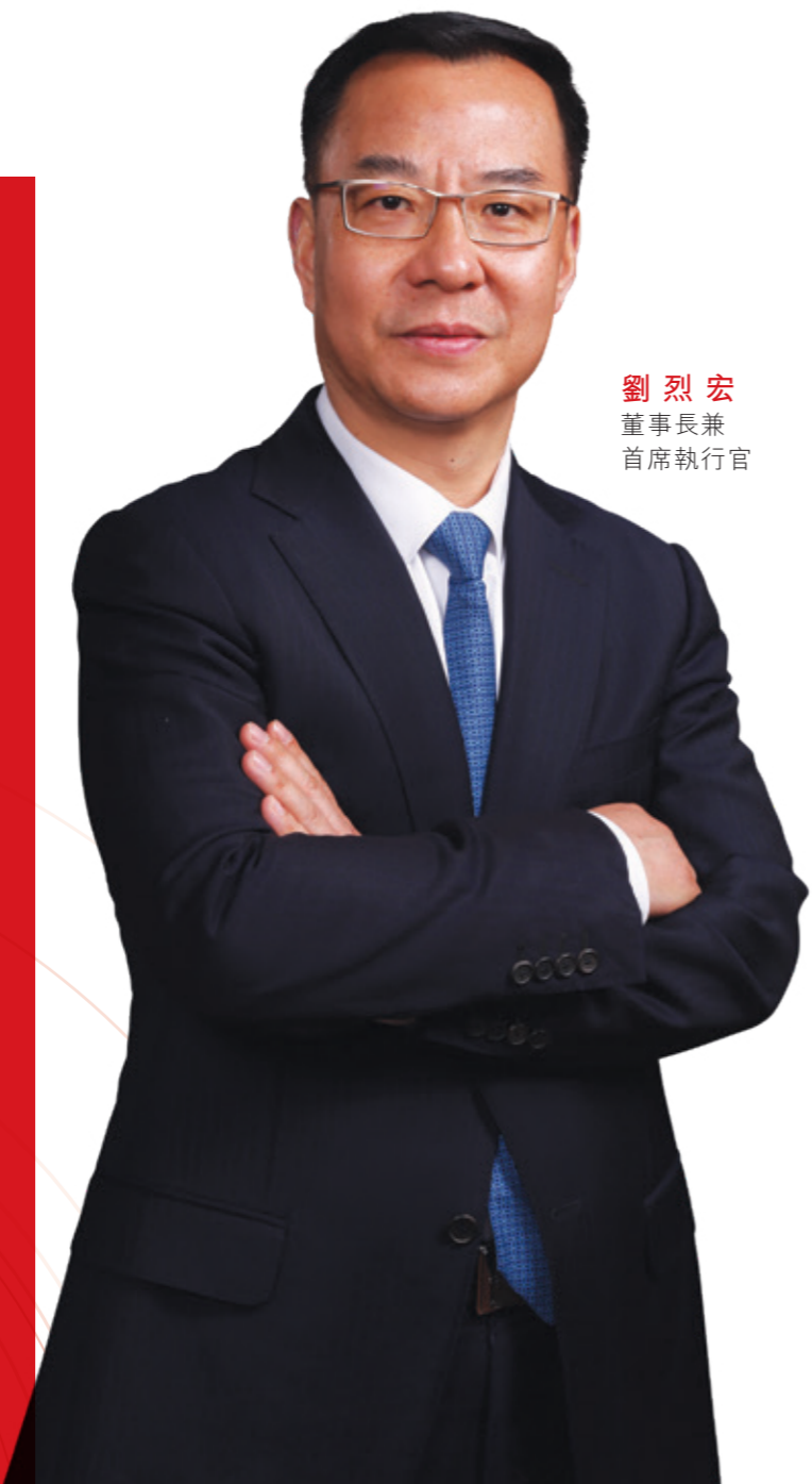
劉烈宏 董事長兼 首席執行官

2021年，面對複雜嚴峻的內外環境，公司緊抓經濟社會數字化轉型大勢，把握新機遇、擁抱新變化、實現新發展，升級「強基固本、守正創新、融合開放」為新戰略，明確「數字信息基礎設施運營服務國家隊、網絡強國數字中國智慧社會建設主力軍、數字技術融合創新排頭兵」為新定位，聚焦「大連接、大計算、大數據、大應用、大安全」五大主責主業，全面發力數字經濟主航道。一年來，經營態勢穩中向好，規模效益實現突破，重點業務穩中有進，創新能力切實增強，改革活力持續煥發，運營效能顯著提升，公司高質量發展躍上新台階。