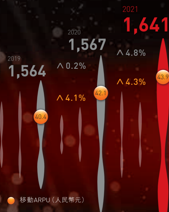
移動服務收入 (人民幣億元)