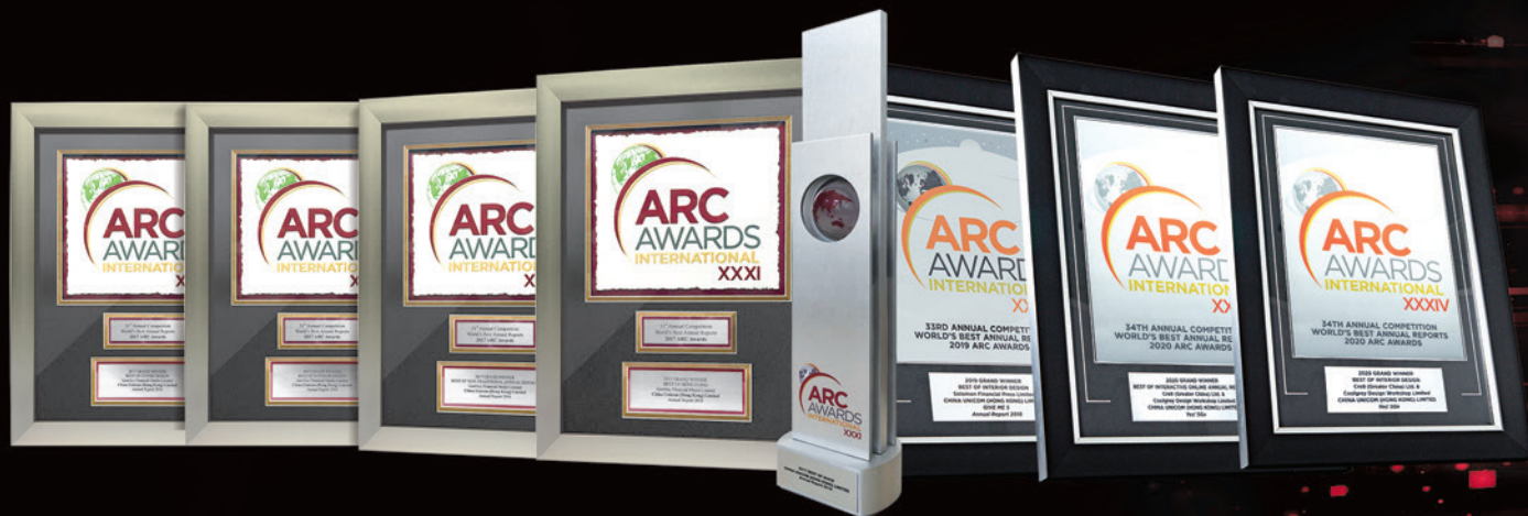
中國聯通年報多年來榮獲國際殊榮

公司持續研究並緊密跟進國際上先進企業管治模式的發展和投資者的要求，定期檢討及加強企業管治措施和實踐，滿足股東期望，深信良好的管治對本公司業務的長遠成功及可持續發展至為關鍵。