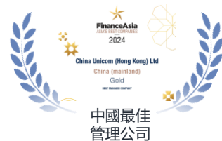
中國最佳 管理公司