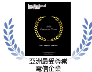
亞洲最受尊崇 電信企業

本公司在香港聯合交易所掛牌上市(股票代號：762)，並為恒生指數以及恒生中國企業指數成份股之一。本公司連續多年入選「世界500強企業」，在2024年《財富》世界500強中位列第279位，並在2024年連續九年獲《機構投資者》(Institutional Investor)評選為「亞洲最受尊崇電信企業」；於《金融亞洲》(FinanceAsia)舉辦的「2024年度亞洲最佳管理公司評選」中獲評選為「中國最佳管理公司」金獎。