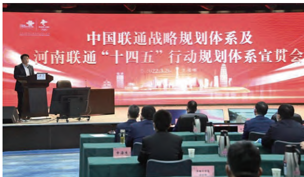
河南聯通召開戰略規劃體系宣貫會

公司管理層克服疫情影響，分赴基層一線，開展對省分公司、子公司、總部部門的全覆蓋式戰略落地專題調研，以保障戰略高質量落地執行。