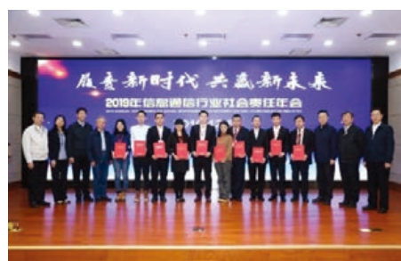
社會責任實踐優秀案例頒獎儀式

中國聯通簽署年會發起的「信息通信行業企業履行社會責任倡議」，作為起草小組成員參與《中國信息通信行業企業社會責任管理體系》和《中國信息通信行業企業社會責任評價體系》兩個行業標準編寫。