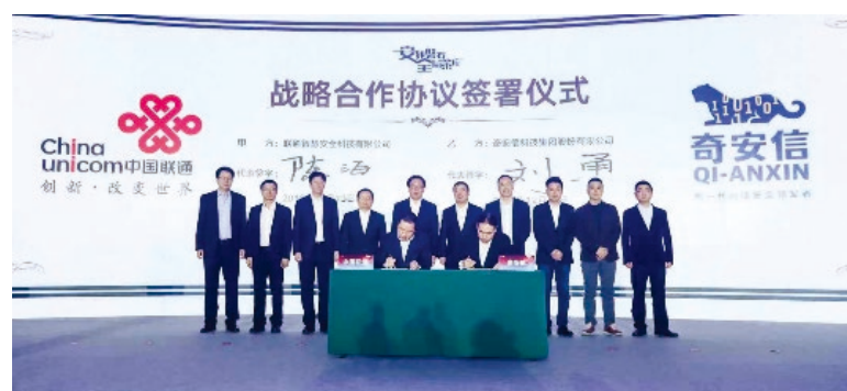
中國聯通與奇安信簽署戰略合作協議

• 2019年12月，與奇安信合資成立雲盾智慧安全科技有限公司，重點合作打造基於網絡安全領域的產品及服務，圍繞「網站安全、態勢感知、安全服務」三個層面提升網絡安全基礎防護水平和效率，為客戶提供多項專業的信息安全服務，構建網絡信息安全新生態。