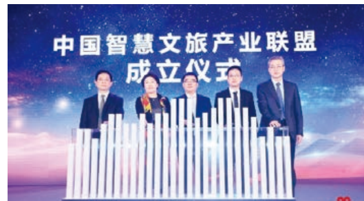
智慧文旅產業聯盟成立儀式

• 2019年3月，與騰訊合資成立雲景文旅科技有限公司，以推動科技+文化+旅遊融合發展為目標，聚焦全域旅遊、大數據與人工智能、文旅營銷服務等三大領域，為客戶提供智慧、多元、有品位、高質量的智慧文旅信息化產業服務。目前已打造出6款產品，並在全國開展重點項目支撐工作。同時，中國智慧文旅產業聯盟宣告成立，成為中國聯通和業內夥伴攜手服務文旅產業的重要平台。