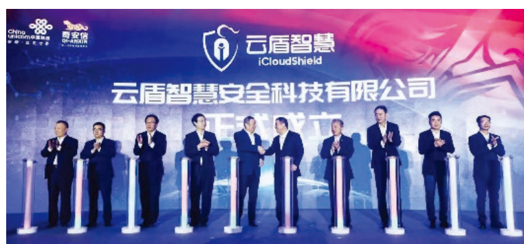
雲盾智慧成立儀式