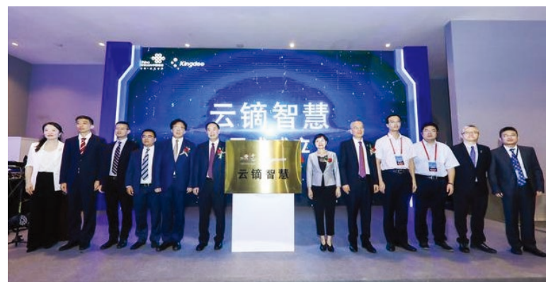
雲鏞智慧成立儀式

• 2019年8月，與金蝶集團合資成立雲鏞智慧科技有限公司，專注於工業互聯網平台研發與運營，通過互聯網與傳統產業深度融合，助力中國製造業加速向數字化、網絡化、智能化方向延伸拓展，加速中國製造高質量發展。截至到目前，中國聯通雲鏞工業互聯網平台已正式發佈上線。