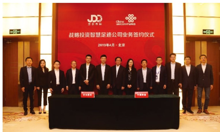
京東戰略投資智慧足跡公司簽約儀式

• 2019年4月，與西班牙電信的合資企業智慧足跡引入京東作為戰略投資者，融合京東能力資源開展業務，打造了「極策」、「極目」、「極智」、「極盾」四大拳頭產品，成功服務國家多個部委、部份省市政府以及多個世界500強企業。