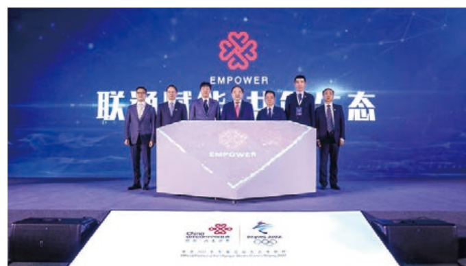
「聯通賦能」全新生態合作品牌發佈