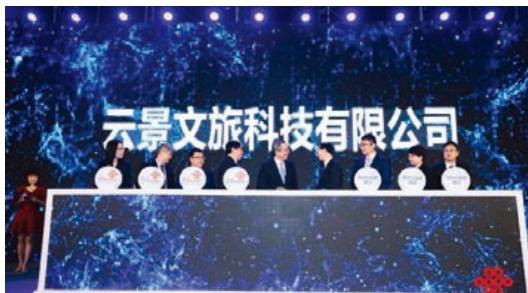
雲景文旅成立儀式

中國聯通與BATJ等混改戰略投資者以及行業頭部企業深度開展資本合作，以資本合作帶動雙方業務合作，共同滿足客戶需求。