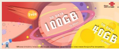
CUniq 英國網站優惠信息