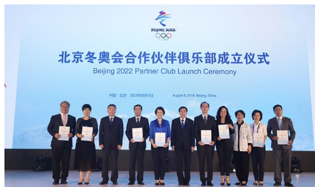
北京冬奧會合作夥伴俱樂部正式成立

設重點城市，探索業務運營新模式；借力混改，加快培育和增強 5G 高質量創新發展的新動能；冬奧為魂，全方位打造首都“智慧冬奧”新名片。