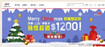
CUniq 香港網站優惠信息