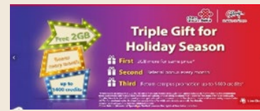
CUniq 美國網站優惠信息