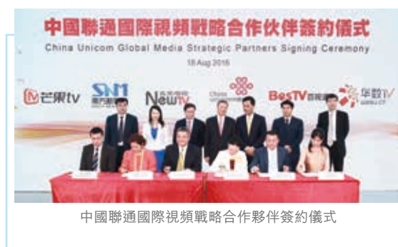
中國聯通國際視頻戰略合作夥伴簽約儀式

中國聯通國際有限公司與未來電視、東方明珠、南廣傳媒、芒果TV、華數傳媒等華語優秀新媒體內容服務提供商高層代表簽署中國聯通國際視頻業務戰略合作意向書，聯手打造互聯網電視海外內容分發基地，建設OTT視頻業務環球分發中心，拓展中國文化交流與合作空間，加強國際傳播能力建設。雙方通過各自投入自身優勢資源，在全球網絡電視市場推廣中共同培育、發展、共享市場成果。