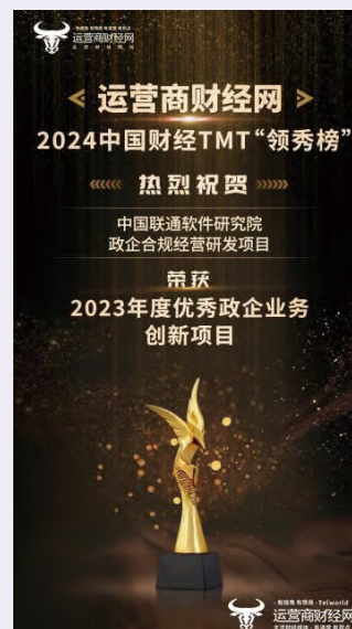
榮獲「2023 年度優秀政企業務創新項目」獎

聯通軟件研究院的政企合規經營研發項目，榮獲「2023年度優秀政企業務創新項目」獎。該獎項由運營商財經網舉辦的2024中國財經TMT「領秀榜」發佈。