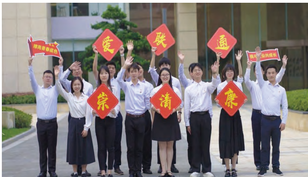
公司幹部員工宣講中國聯通廉潔文化核心理念