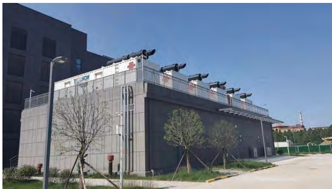
中國聯通西北智雲數據中心

黑龍江聯通將數字孿生與智慧運營相結合，打造綠色數據中心。以「數字孿生」技術實現基礎設施資源3D可視化呈現和穿透，通過物理實體與數字孿生體之間形成精確映射，實現參數一致、調動一致。工程師只需鼠標拖拽即可洞察現場問題、調整設備狀態、優化系統能效，電能利用效率從1.5降低到1.4，數字孿生系統的逐步建設，為未來建成數字化智能生命體、在數字空間完成生產運營提供可能。