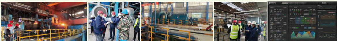
建設鋼鐵碳雲平台，助力鋼鐵行業提升能效

聯通智慧鋼鐵軍團攜手秦皇島佰工鋼鐵有限公司，探索鋼鐵行業能碳管理創新應用，針對多生產工序用能、多能源融合深入探索。通過建設貫穿鋼鐵企業生產全過程的鋼鐵碳雲平台，實現能源生產、存儲、消耗數據的實時採集、異常告警，達到扁平化的能源故障監測、根因分析及策略推送。通過能源高級預測調度模型，實現煤氣、蒸汽、電力、壓縮空氣、水等副產能源介質的實時預測、平衡調度，將事後處理轉變為事前干預，提升整體能源利用效率，降低能源成本，促進鋼鐵行業節能降碳綠色發展。